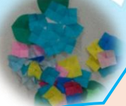
5/30 アジサイを折りました