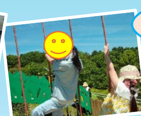
5/9 大野城いこいの森へ行きました