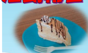
5/2 ミルクレーブを作りました